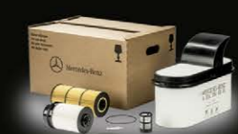
Комплект фильтров Actros New, Antos, Arocs