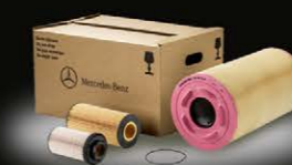
Комплект фильтров Axor