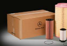
Комплект фильтров Actros

Всем клиентам, кто воспользуется специальным предложением – канистра масла в подарок!